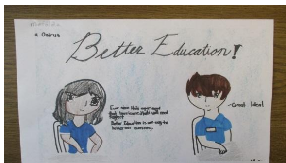
Leeftijd 11 doel #4 kwaliteitsopvoeding Our Lady of Victory West Haven CT

Leerlingen uit Congo, de US en India namen deel aan de kunstwedstrijd met als thema: het belang van ontwikkelingsdoelen en hoe ze invloed hebben op waar we leven.