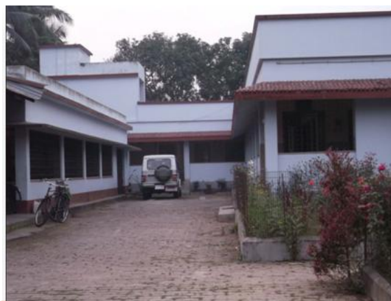
Het kloostergebouw in Raiganj